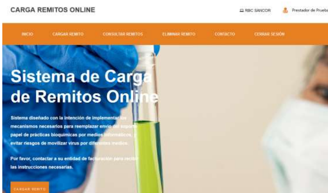
Figura 3.2.1: Menú Principal del Sistema de Remitos

La página Principal nos muestra las opciones que tenemos disponibles para utilizar estando ya logueados. Ver Figura 3.2.1