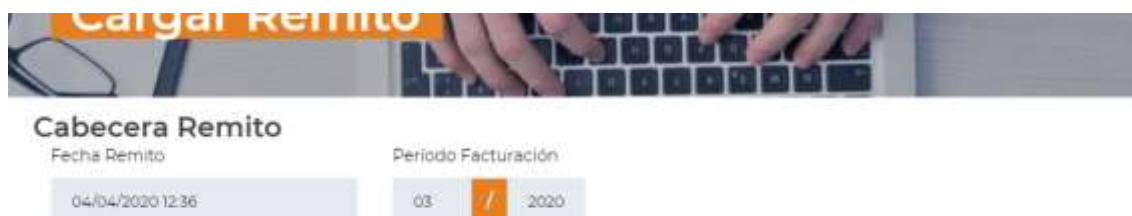
Figura 3.3.1: Detalle Cabecera de un Remito

También podemos ingresar / modificar el periodo de facturación correspondiente a las órdenes que contendrá el remito. Ver Figura 3.3.1