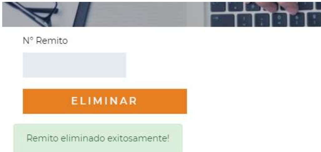
Figura 3.5.1: Eliminación de Remitos

Para Eliminar un remito ya emitido, debemos ingresar el n° de remito que queremos eliminar y al hacer clic en el botón Eliminar borramos ese numero de remito y por consiguiente se liberan todas las autorizaciones que contenia el mismo, estando disponibles nuevamente para su nueva selección en la generación de remitos. Ver figura 3.5.1